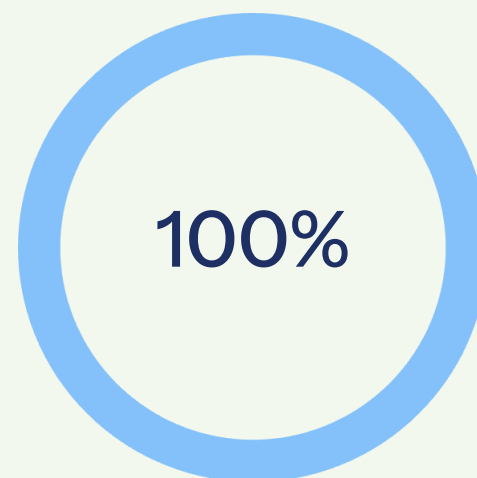
Охват обучением Руководителей всех подразделений